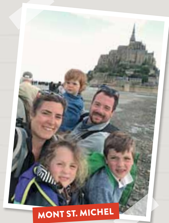
MONT ST. MICHEL

Tous, au passage, parfaitement néophytes d'un mode de transport choisi pour ses vertus économiques, sa robustesse et le minimum de confort qu'il offre à une famille en goguette.