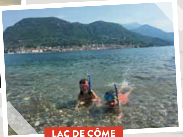
LAC DE CÔME

off on the Croatian coast. From Istria to Dalmatia; the lesser-known Pula, Zadar or Trogir to the unmissable Split, Dubrovnik and Zagreb; the Plitvice lakes to the village of storks (Čigoč); Croatia captivated us throughout July with its turquoise waters, nature jewels and marvellous heritage.